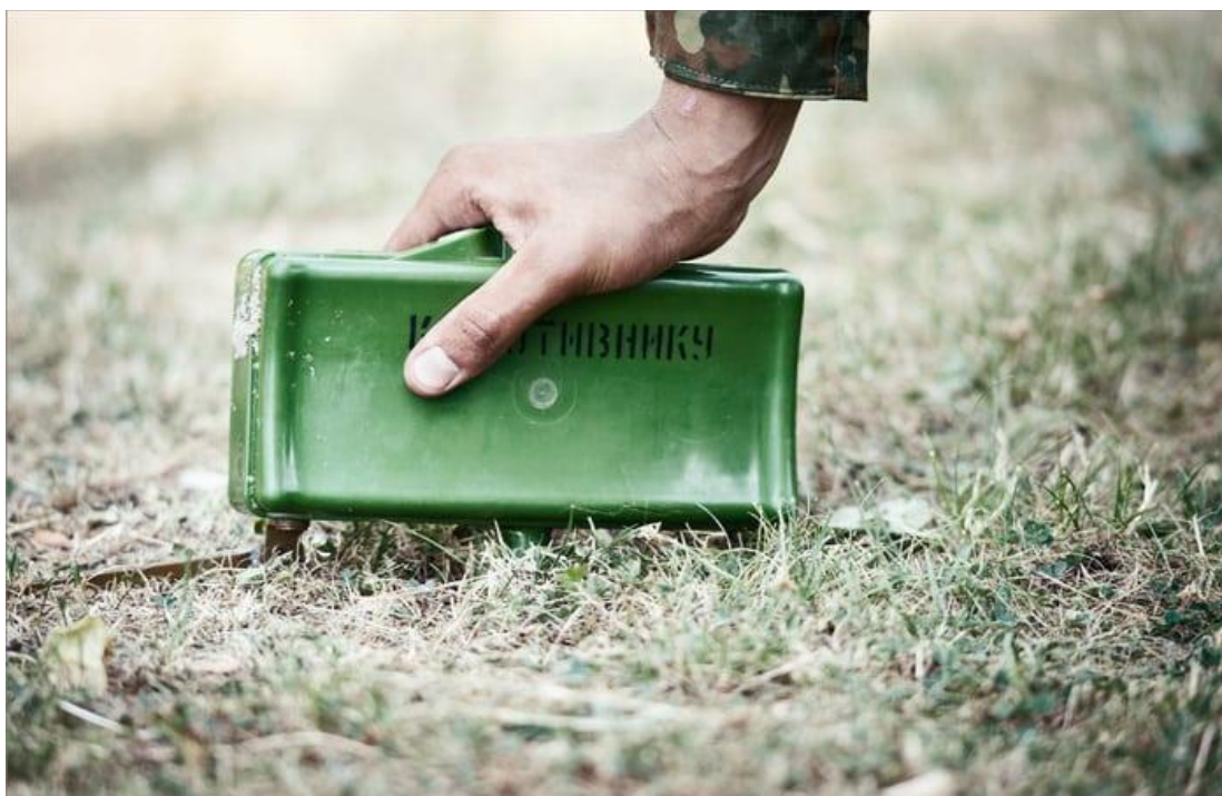
Мина в боевом положении