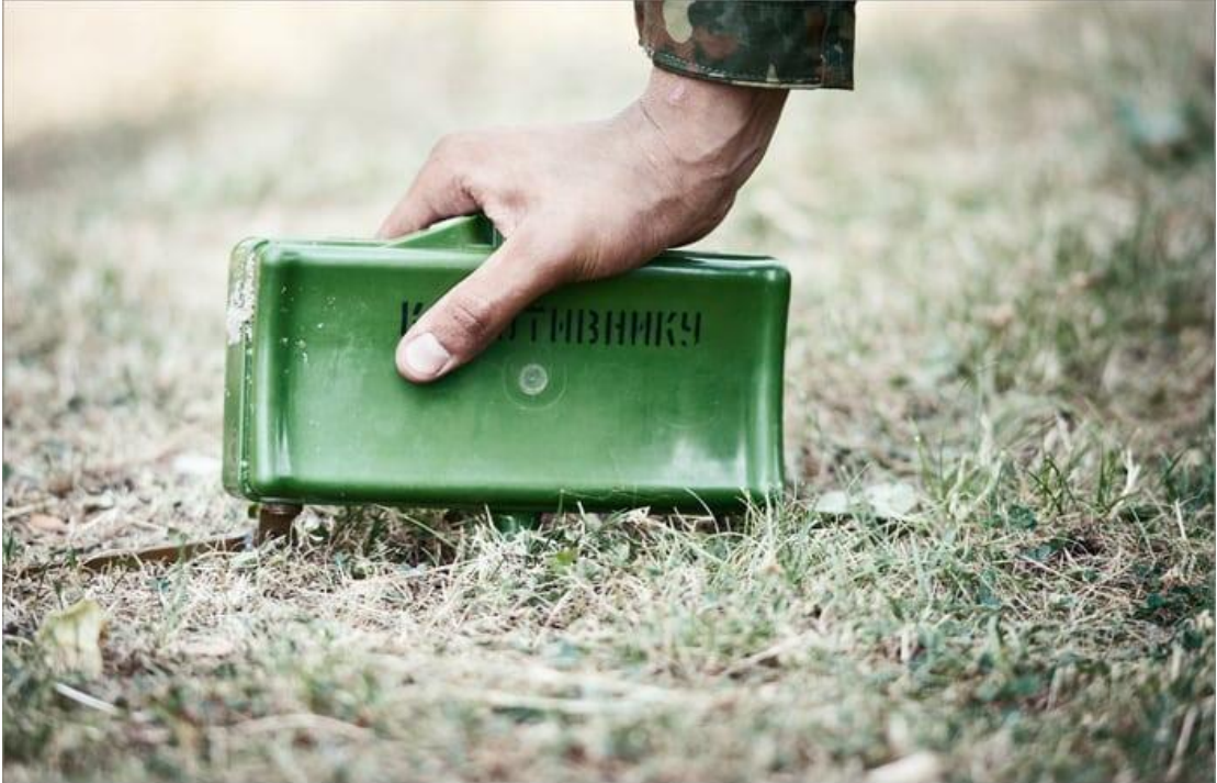
Мина в боевом положении