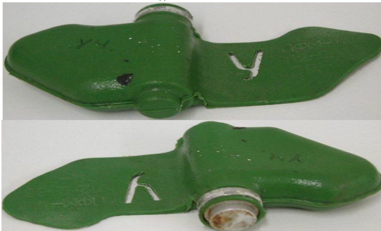
Внешний вид « Ми́ны – ЛЕПЕСТКА »:

Масса мины 80 грамм, размеры – 12 x 6 сантиметров, чувствительность мины лежит в пределах 5-25 кг, что вполне достаточно для срабатывания от веса маленького ребенка.