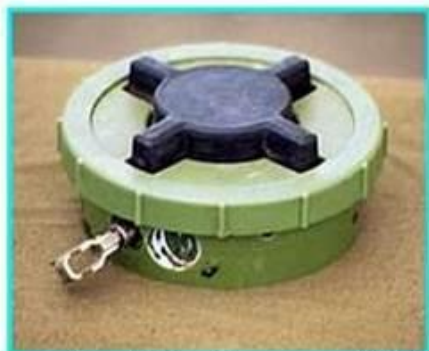
Рис.1 Общий вид мины ПМН-2